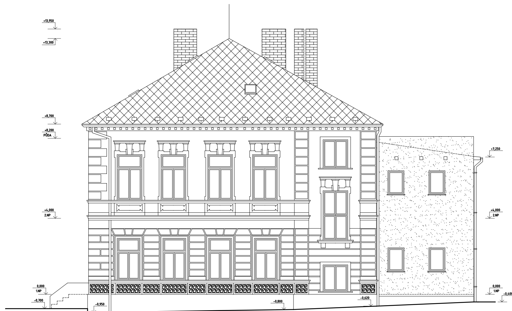
POHLED VÝCHODNÍ - BOČNÍ