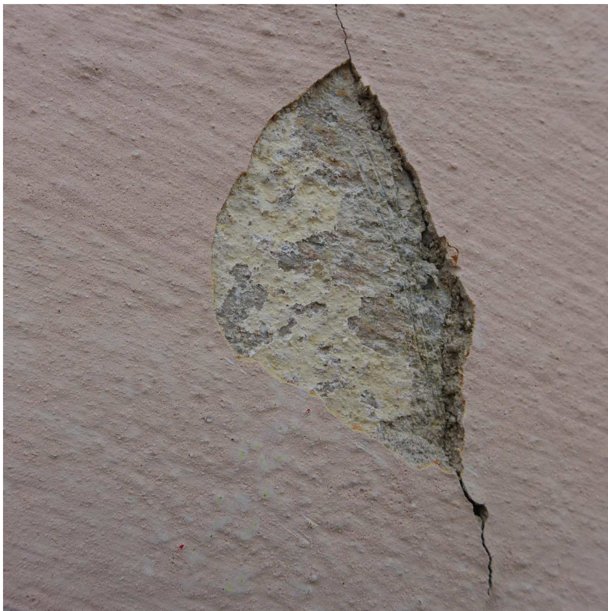
S3 – detail ploch fasády s tvrdou cementovou krustou posledního přestukování, které bylo opatřeno pouze dvojicí fasádních nátěrů – spodní první byl okrově žlutý, druhý nátěr pak stávající lososově růžový