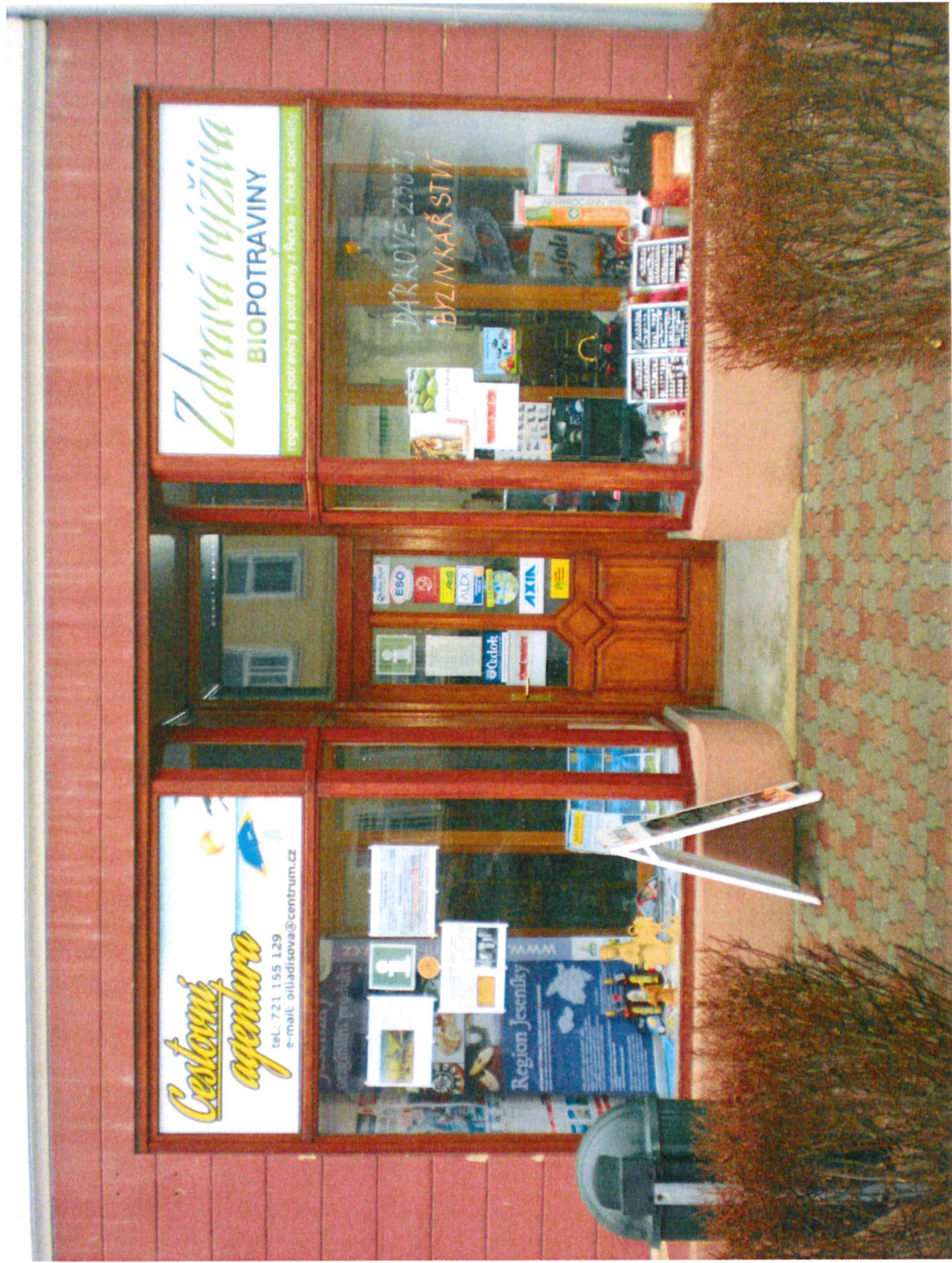
Obr. 5. Současný výkladec na domě čp. 21