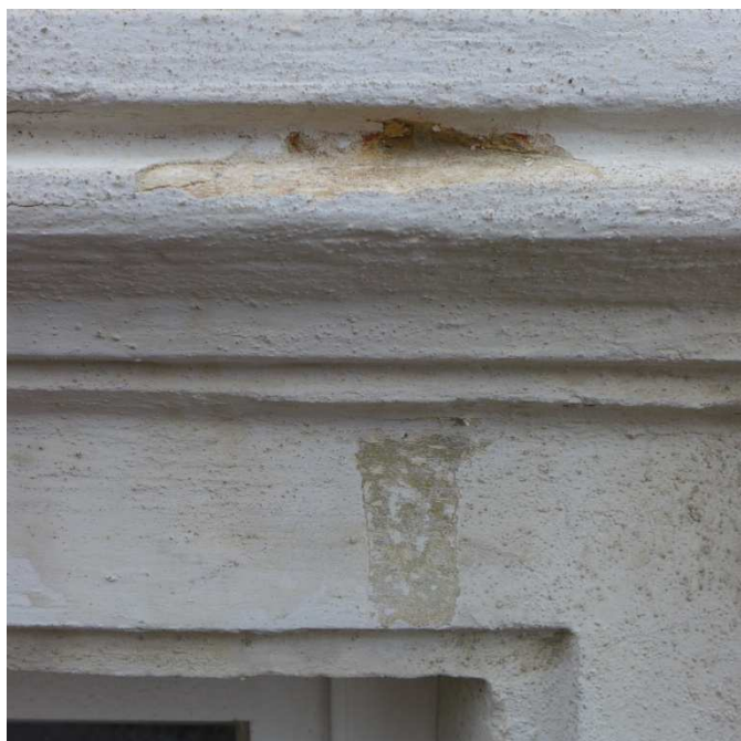
S5 – okenní šambrána; na špaletě je patrná spodní část sondy s novějšími omítkami a s menším množstvím barevných vrstev, horní část sondy dokazuje, že špaleta nebyla opravovaná po celé ploše, ale jen lokálně