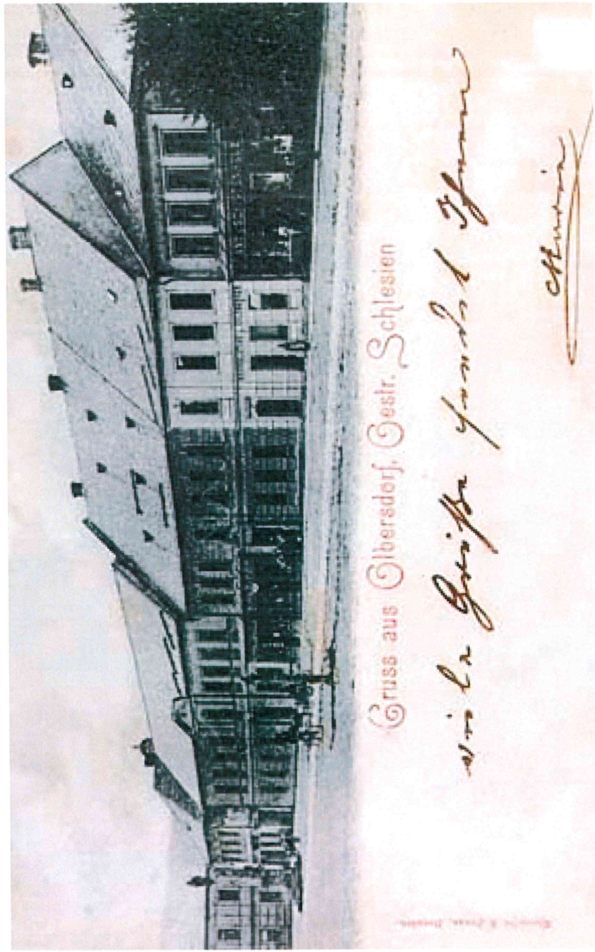
Obr. 4. Pohled na náměstí od jihovýchodu – řešený dům čp. 21 je vidět jako třetí zleva