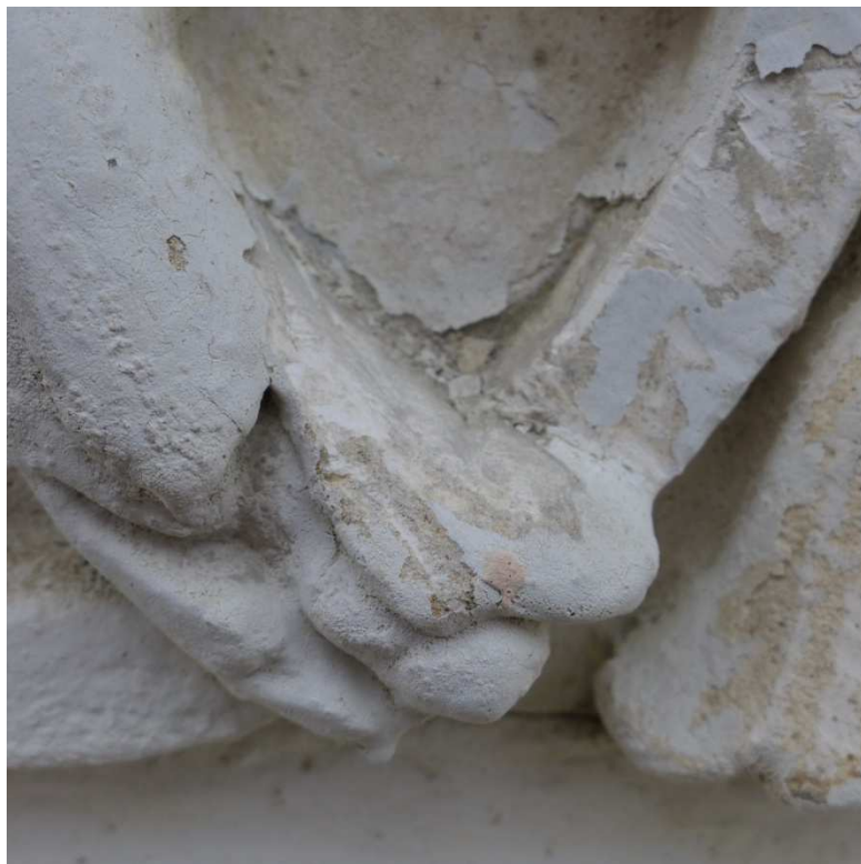
S6 – sonda na trojúhelníkovém štukovém prvku rozviliny (vylito jako výdusek z několika kusů) nad okenním otvorem ve 2.NP v ose domu nad vstupem ve zvýrazněném středovém rizalitu