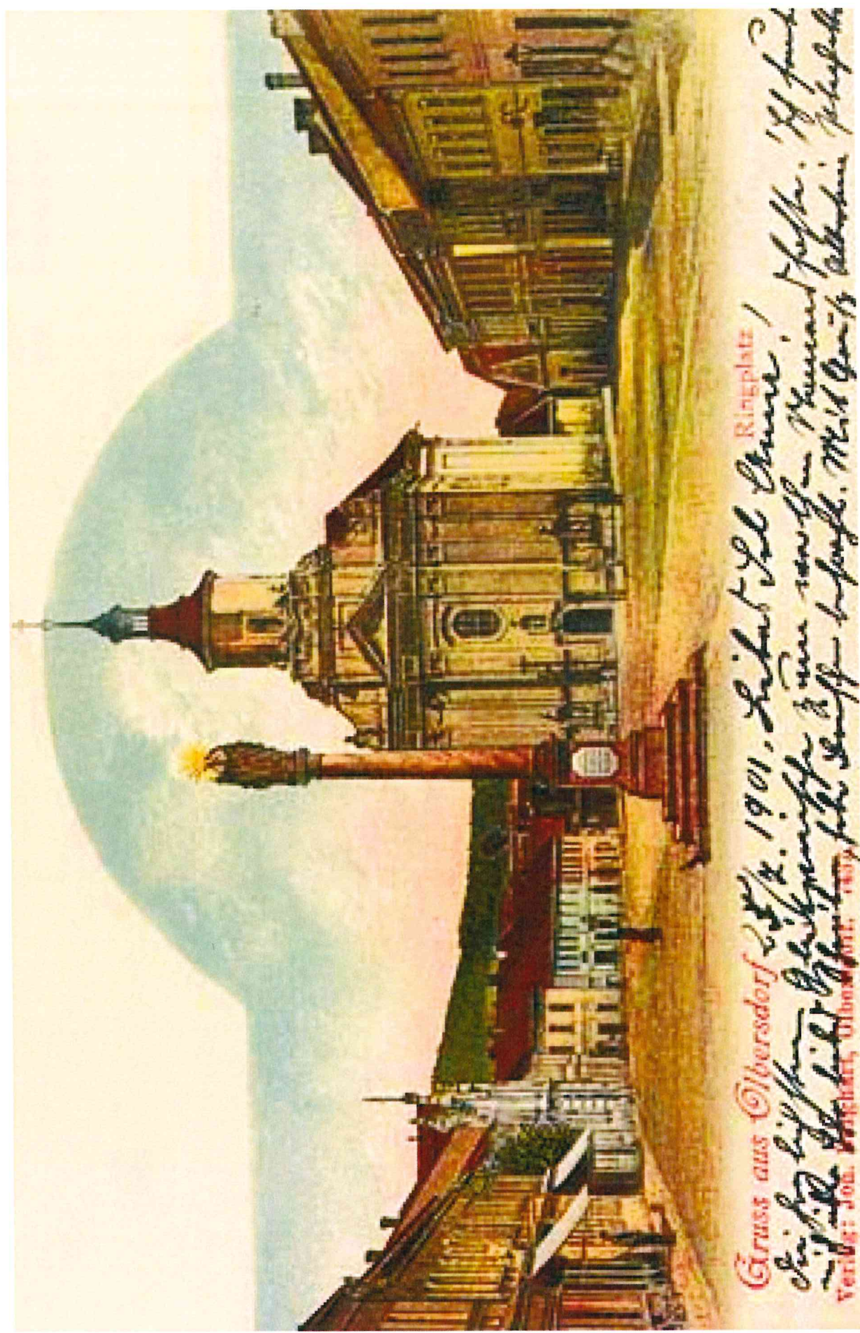
Obr. 2. Pohled na náměstí od západu — část řešeného domu čp.21 je vidět zcela vlevo