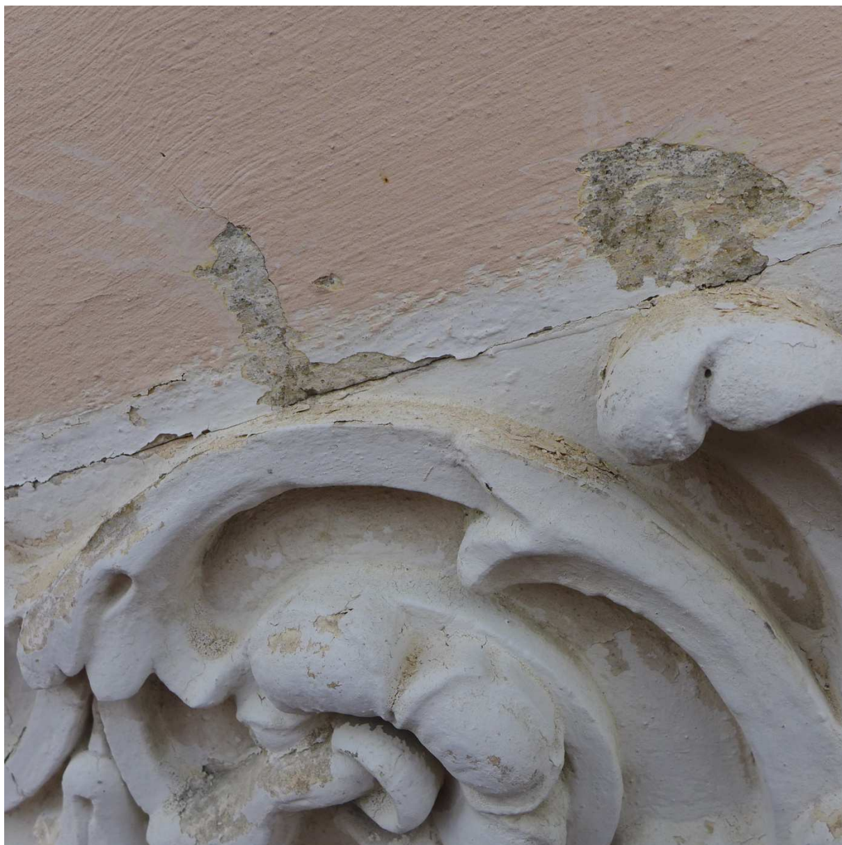
S 8 – navazující plocha fasády mimo vsazený štukový prvek je opatřena tvrdými cementovými omítkami opatřenými pouze dvěma nátěry – světlý okr, lososově růžová