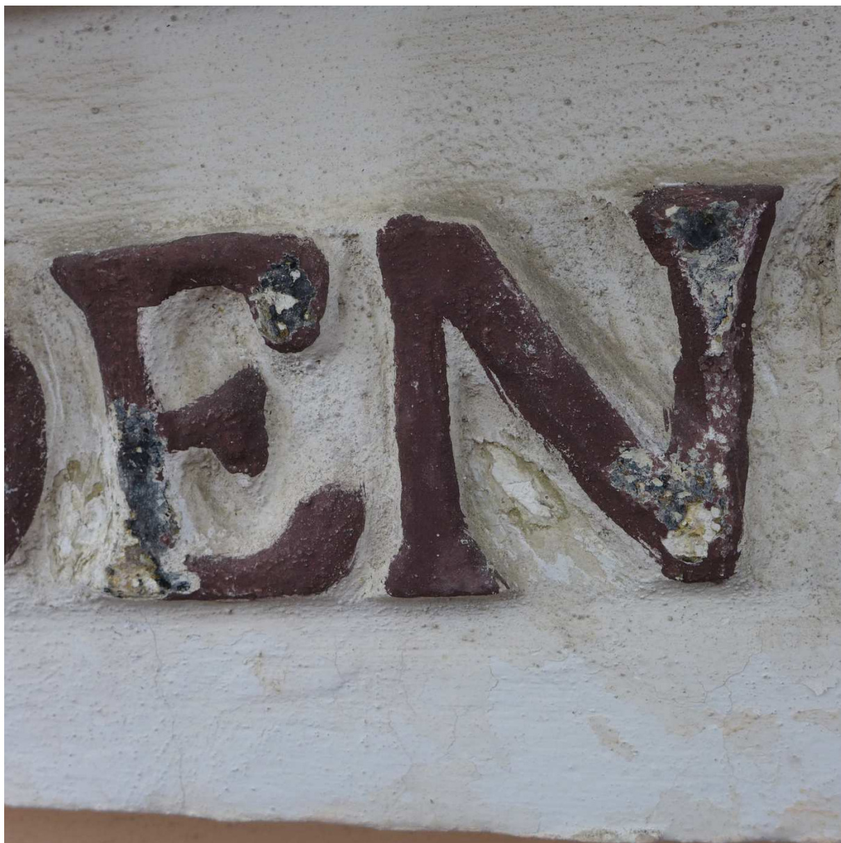
S12 – pod některým černým nátěrem je patrný žlutý nátěr s matalickou příměsí vyhlížející jako zlacení, pod zlacením pouze bílý nátěr a pak štuková hmota písmene.