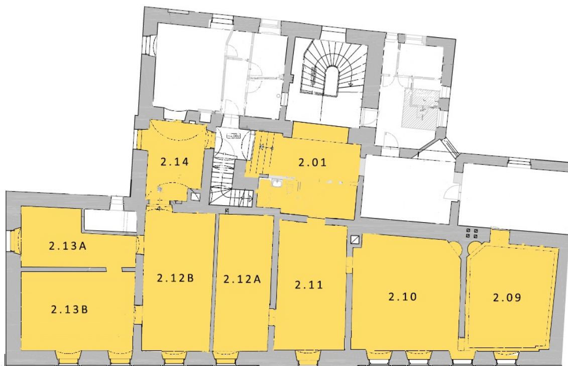
Půdorys 2. NP s barevným vyznačením prostor, které mají být podrobeny sondážnímu průzkumu

V tištěné dokumentaci budou vyobrazeny pouze sondy s nejvíce výpovědní hodnotou, kompletní fotodokumentace bude ke shlédnutí na přiloženém CD nosiči.