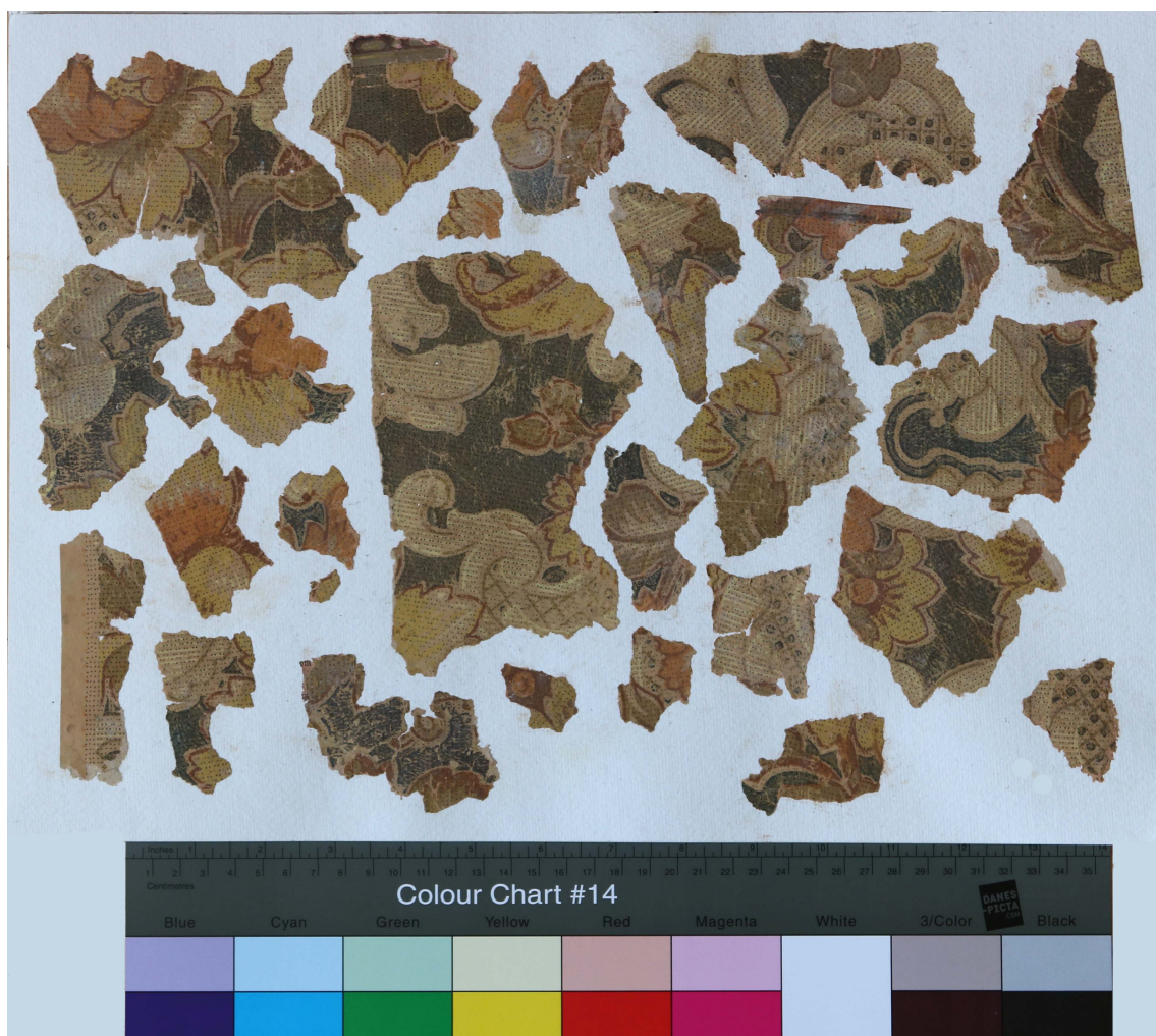
Fragmenty papírové tapety nalezené na podlaze ve stavební suti.