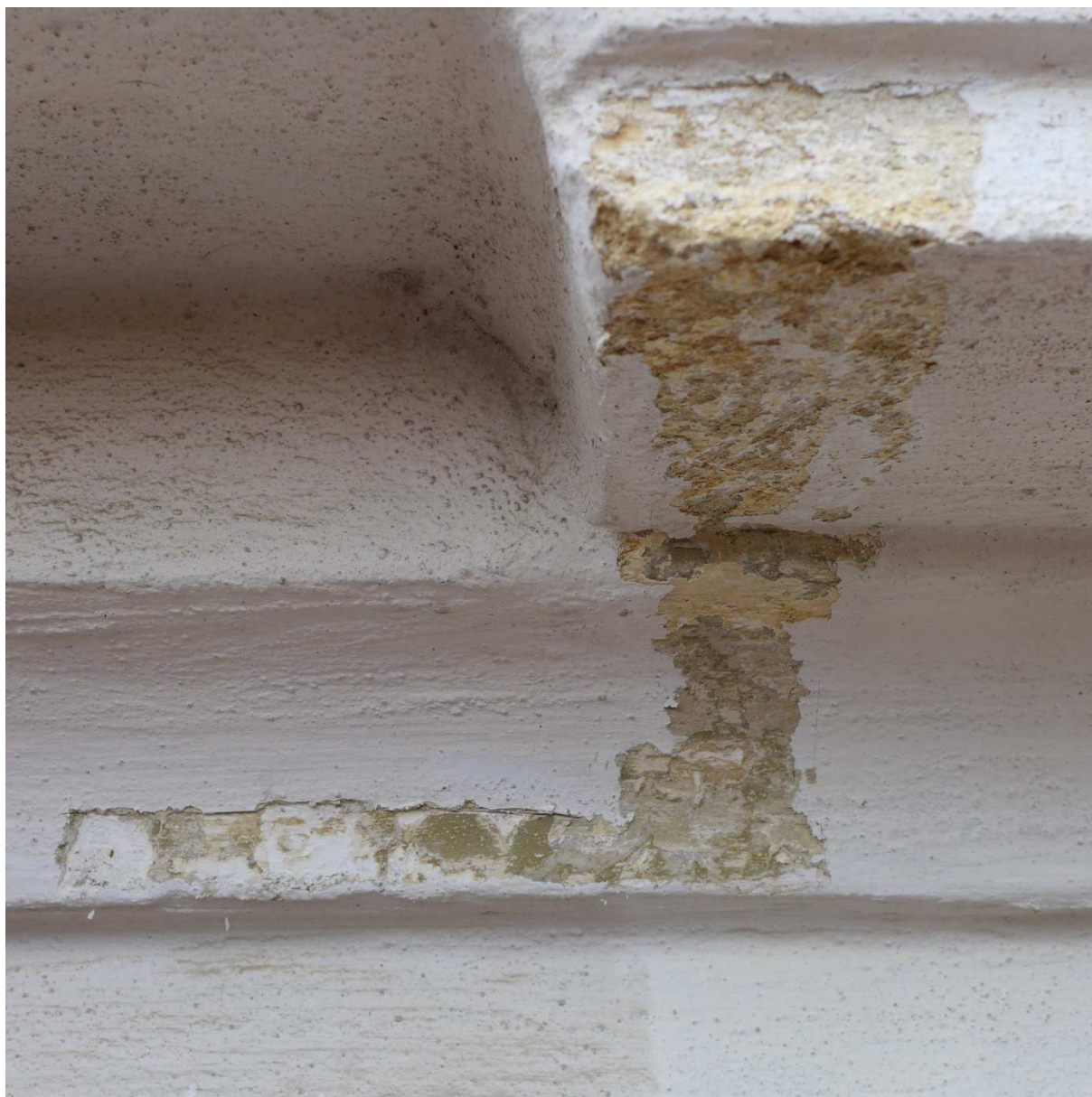
S4 – štuková výzdoba tympanonu a jeho korunní římsy s konzolou zachycuje několik historických barevných vrstev fasády s překvapivě šedozeleným nátěrem vyskytujícím se ve druhé nejstarší barevné vrstvě.