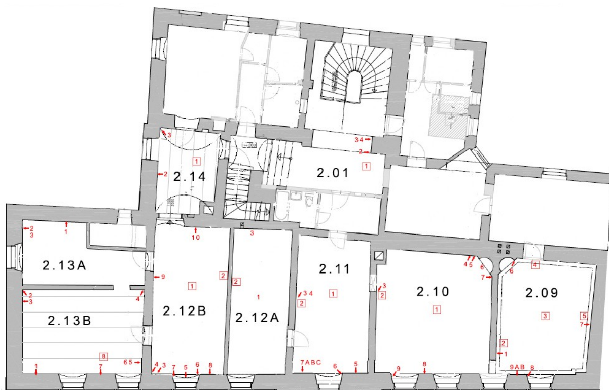
Vyznačení míst provedených sond.