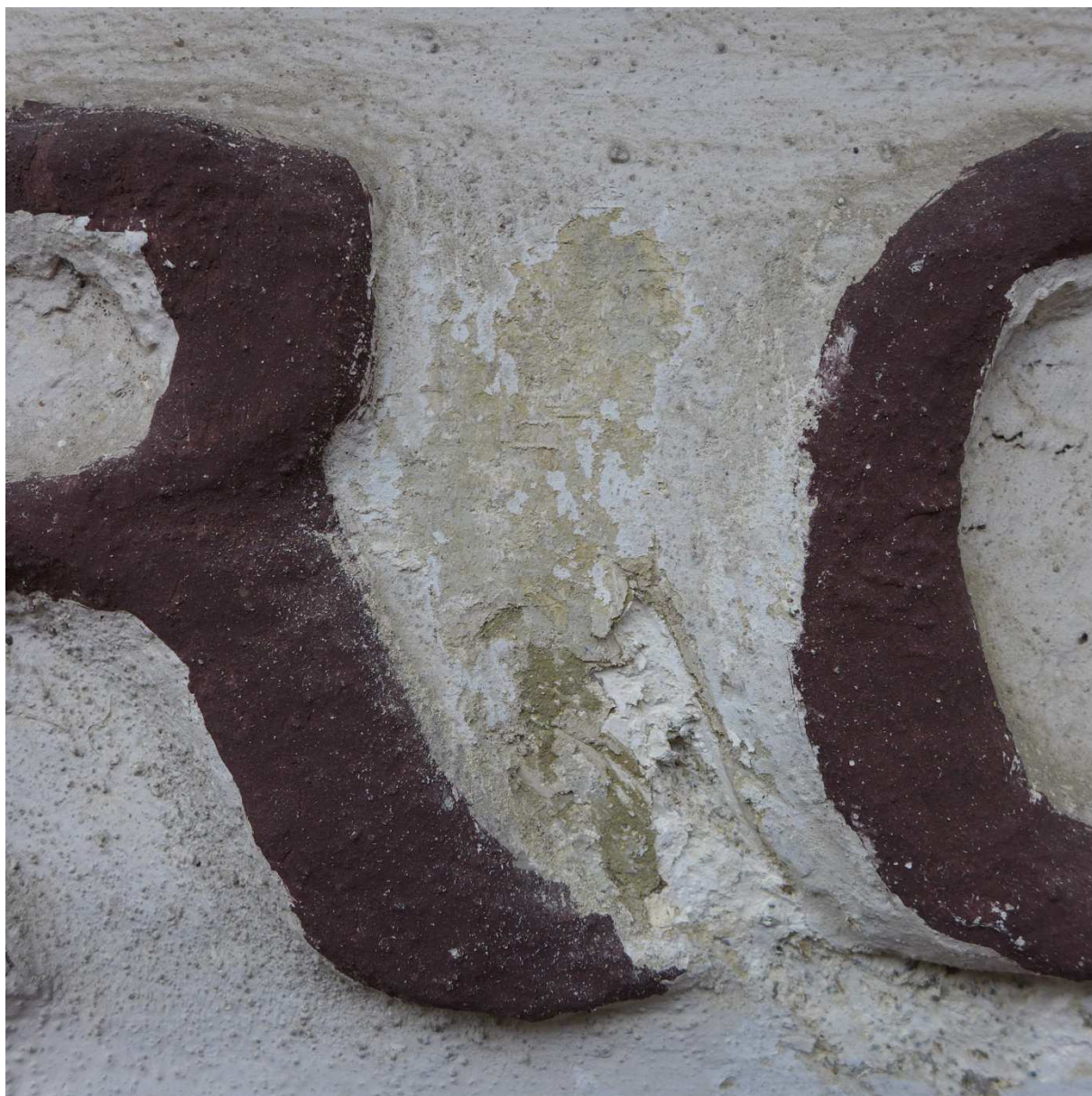
S10 – nápis na římse pod tympanonem PROVIDENTE DF OOMNIA FAUSTA (obezřetně všechno ?), jednotlivá písmena viz sondy 11 a 12; plocha mezi písmeny vykazuje několik vrstev historické výmalby fasády, počet i barevnost koresponduje se sondami S4 a S5.