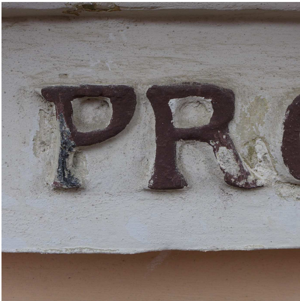
S11 – písmena jsou na některých místech nově doplněná cementovou maltou – viz. nožička písmene R a na něm se nachází pouze jeden tmavě hnědo vínový barevný odstín. Na jiných písmenech pod stávajícím vrchním nátěrem se vyskytuje barevný nátěr černý.