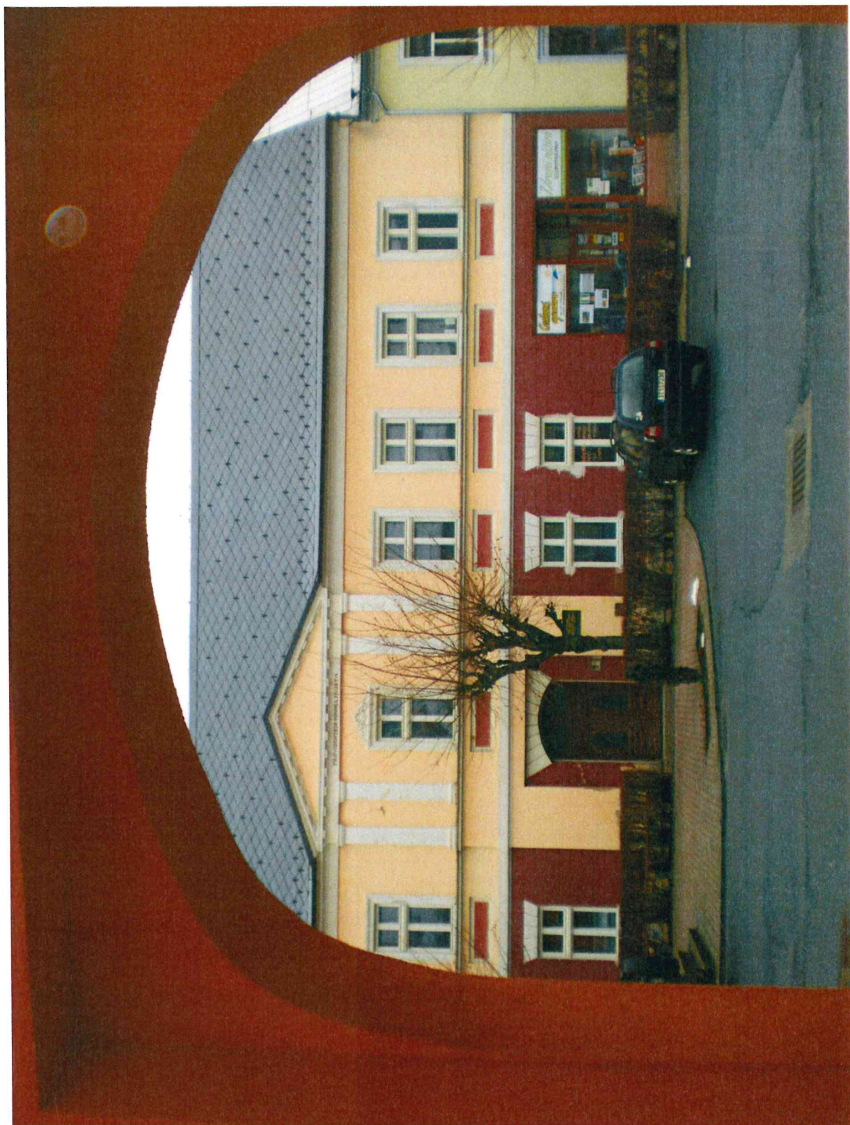
Obr. 6. Pohled na dům čp.21. od jihu