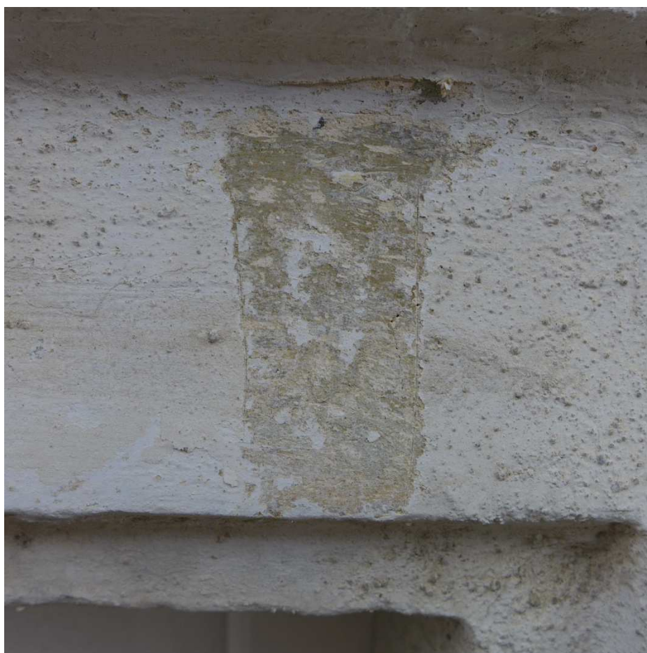
S5 – detail sondy S5, sonda dokládá shodný počet barevných vrstev jako u S4