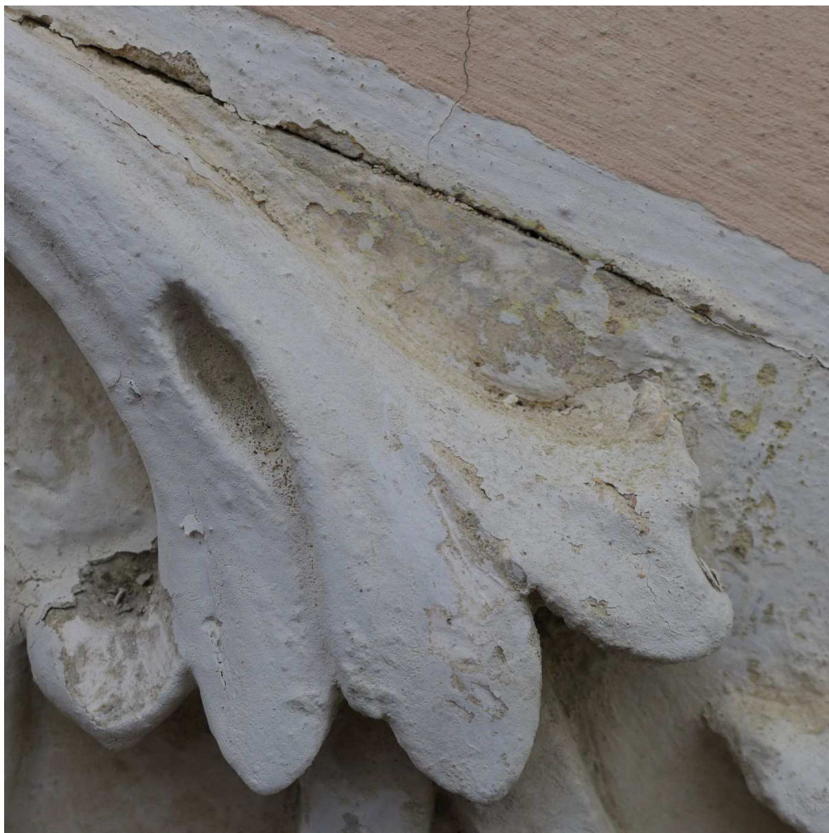
S9 – detail štukové výzdoby – lokace viz. sonda S6; pod bílým nejmladším nátěrem je lokálně patrný světle šedý nátěr, místy se vyskytuje pouze štuková jádrová hmota a na ní bílý nátěr, v tomto případě se nejspíše jedná o nedávnou opravu štukové výzdoby – o její doplnění.